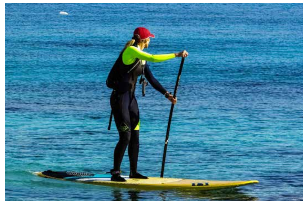
Prenez un bol d'air, participez à une sortie en mer avec différentes activités nautiques à la clé.