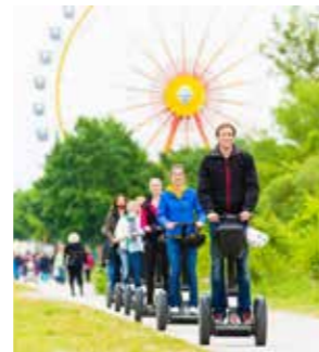
BALADE EN SEGWAY