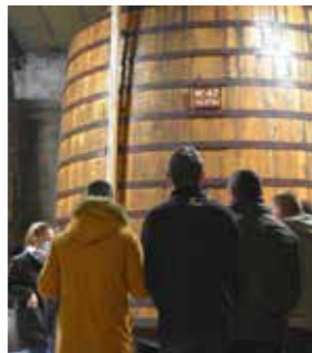
VISITE DE DISTILLERIE