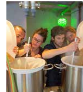
CRÉATION DE BIÈRES ARTISANALES