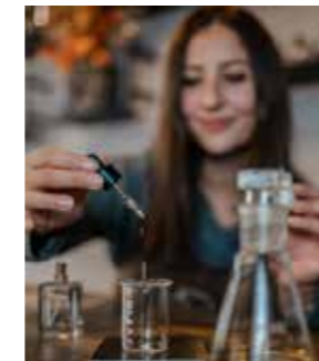
CRÉATION DE PARFUM