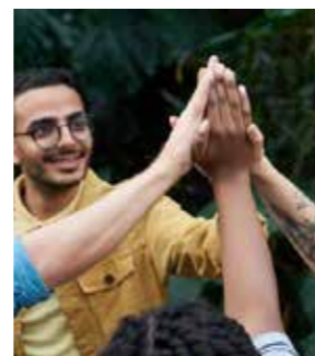
JEU DE PISTES